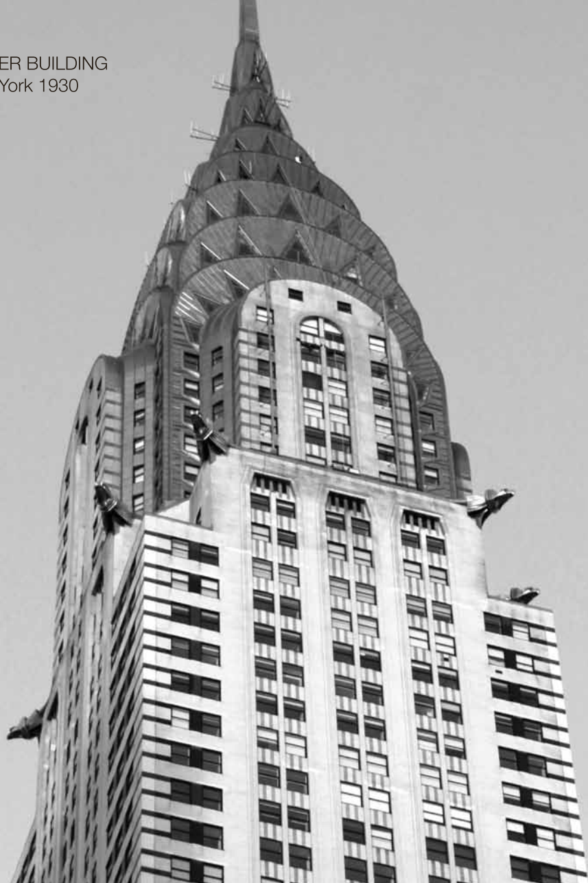
CHRYSLER BUILDING New York 1930