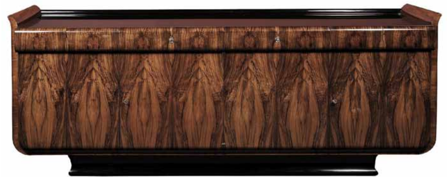
Art Deco solitér z kolekce „Tulipán“ design Jindřich HALABALA 1935.