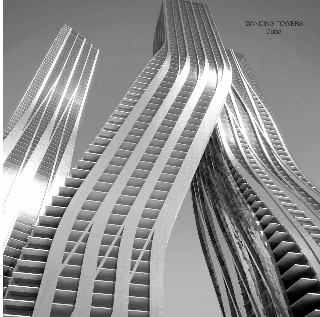
DANCING TOWERS Dubai