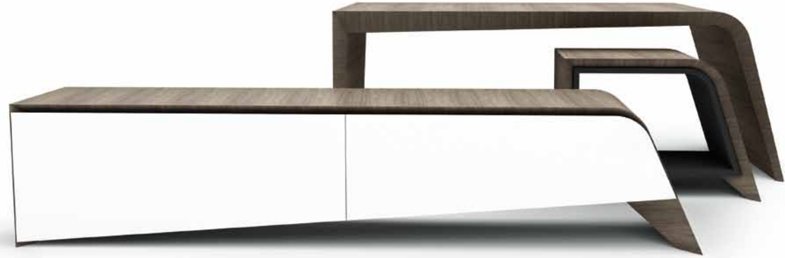
HDeco - HANÁK Design Collection 2011